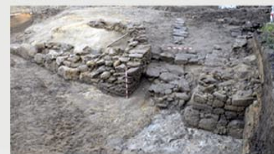
Porta mariña do castro de Alobre